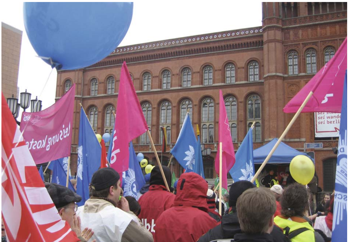
Massive Proteste am 10. April 2008 vor dem Roten Rathaus.

Die Gespräche mit dem Senat haben bislang zu keinem greifbaren Fortschritt geführt. Verhandlungsführer Körting und Finanzsenator Sarrazin verweigern sich. Gestiegene Lebenshaltungskosten, langjährige Opferbereitschaft der Berliner Kolleginnen und Kollegen sowie der Abschluss bei Bund und Kommunen sind für sie kein Argument. Unbeirrt ziehen sie die Tarifmauer rund um Berlin hoch. Dagegen haben 10.000 Beschäftigte des Öffentlichen Dienstes am 10. April 2008 lautstark, wütend und in großer Einmütigkeit demonstriert. Die Gewerkschaften des DGB und die dbb tarifunion hatten zum Warnstreik aufgerufen und die Beschäftigten folgten entschlossen.