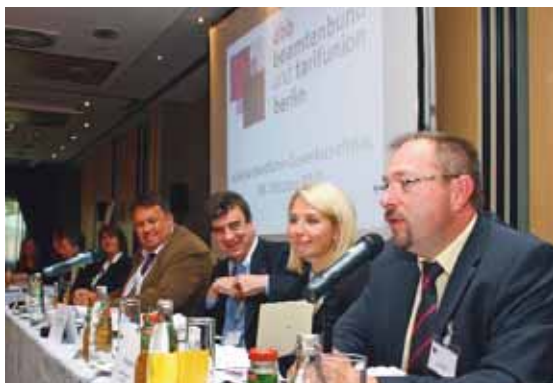
Die Bundesjugendleiterin der dbb jugend, Sandra Hennig, fühlt sich offensichtlich wohl auf dem außerordentlichen Gewerkschaftstag des dbb berlin.

Auf dem außerordentlichen Gewerkschaftstag des dbb berlin am 6. Oktober 2010 präsentierte die Bundesjugendleiterin der dbb jugend, Sandra Hennig, die neue Gewerkschaftsarbeit für die Jugend im öffentlichen Dienst.