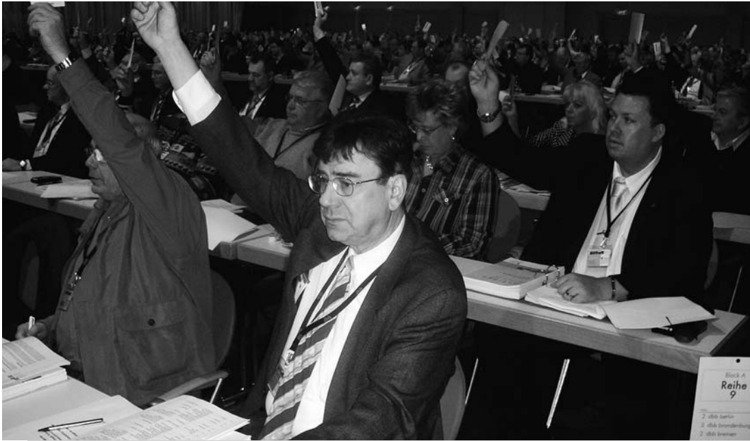
Die Delegierten des dbb berlin während einer Abstimmung auf dem Gewerkschaftstag des dbb vom 25. bis 28. November 2007 im Estrel Convention Center Berlin.

Verantwortlich i. S. d. P.: Joachim Jetschmann, p. A. dbb berlin, Mommsenstraße 58, 10629 Berlin, Telefon 0 30/3 27 95 20, Telefax 0 30/32 79 52 20, E-Mail: post@dbb-berlin.de. Einzelmitglieder des dbb berlin erhalten das hm kostenlos zugesandt. Herausgegeben in Zusammenarbeit mit dem dbb verlag GmbH, Friedrichstraße 165, 10117 Berlin. Anzeigenverkauf: dbb verlag GmbH, Katy Netz Telefon 0 30/7 26 19 17 24, Telefax 0 30/7 26 19 17 40 Herstellung: Vereinigte Verlagsanstalten GmbH, Höherweg 278, 40231 Düsseldorf. Layout: Marian-Andreas Neugebauer.